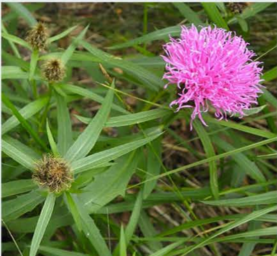
FIORDALISO di BIELLA