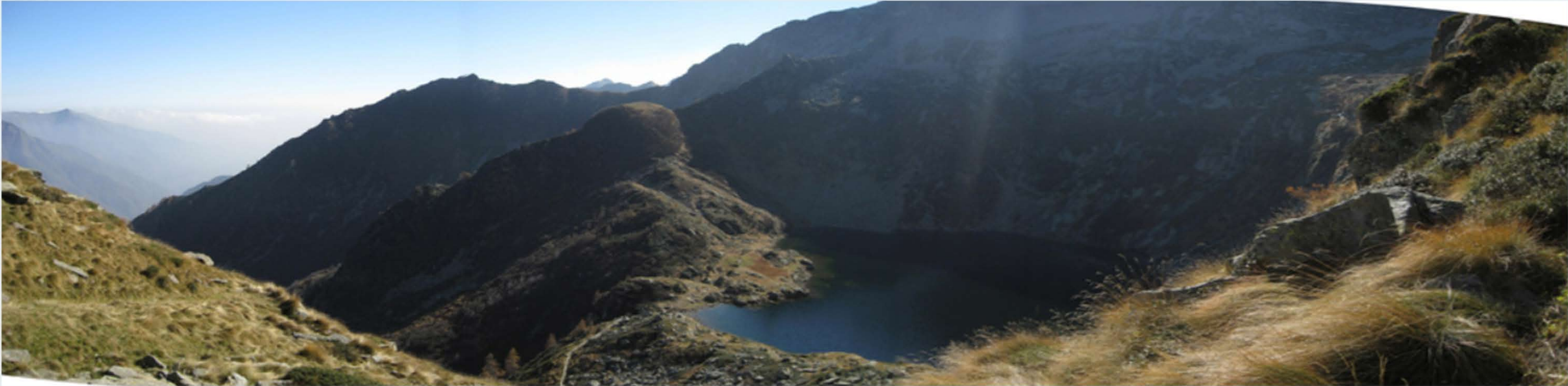
1 - Il lago della Vecchia, 13 agosto 2017.